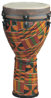
Kinte Kloth 10“, 12“, 14“, 16“