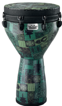
Green Kinthe 14“