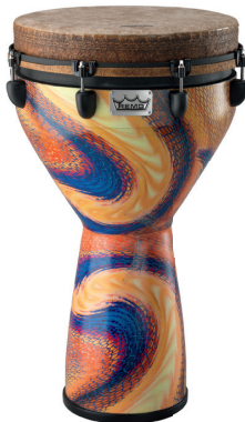
Serpentine Day 14“